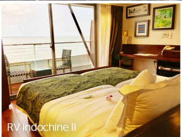
RV Indochine II