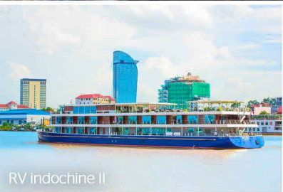
RV Indochine II